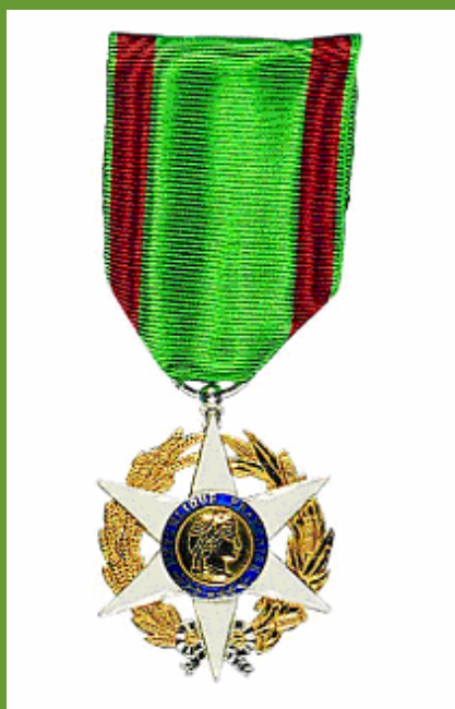
Ordre du Mérite agricole (Chevalier)