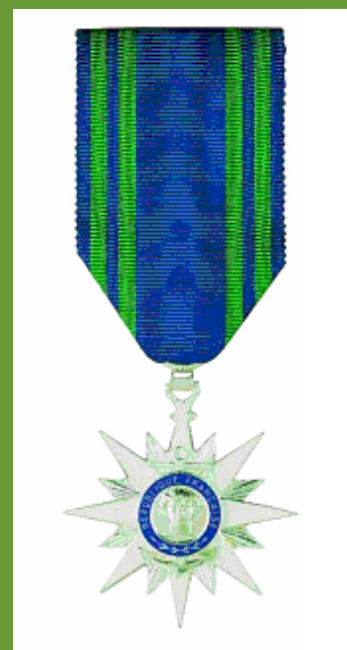
Ordre du Mérite maritime (Chevalier)