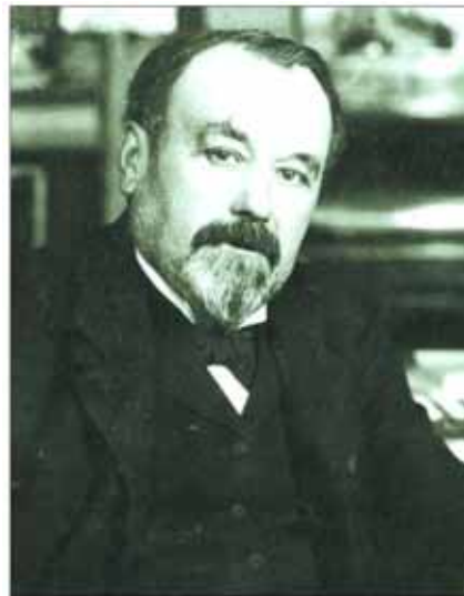
Jean Dupuy, 1844-1919.

L'ancienneté dans le grade pour passer au grade supérieur est fixée à cinq ans