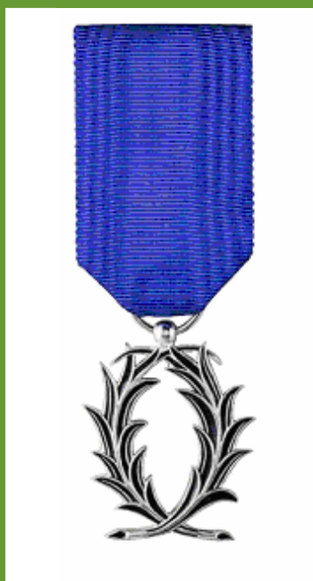
Ordre des Palmes Académiques (Chevalier)