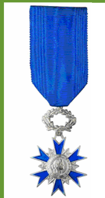
Ordre National du Mérite (Chevalier)