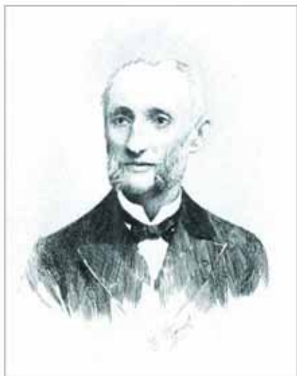
Jules Méline, 1838-1925.